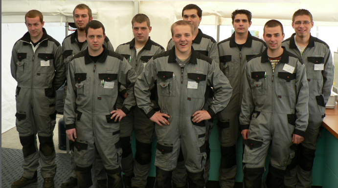
Les neuf candidats retenus après l'épreuve écrite pour passer les épreuves pratiques.