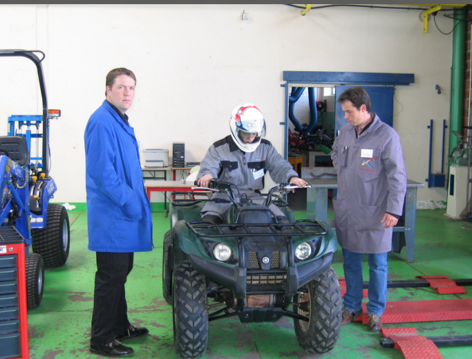
Les candidats en train de réfléchir et de faire des essais sur leur poste d'épreuve.