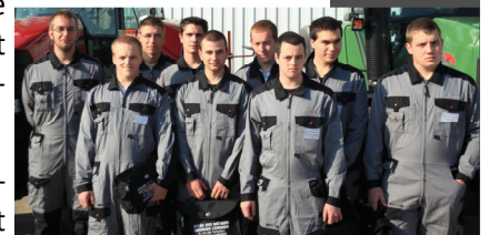
Les neuf candidats au CGM

Un jury composé de professionnels et d'enseignants des trois spécialités (matériels agricole, travaux publics et de manutention, parcs et jardins) était présent pour évaluer les compétences des neuf candidats dans les trois domaines.