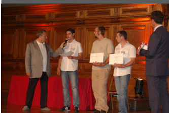
Remise des diplômes à la Sorbonne

"ce fut une belle expérience que je recommande à tous le monde, en plus l'ambiance est sympa!" Un candidat