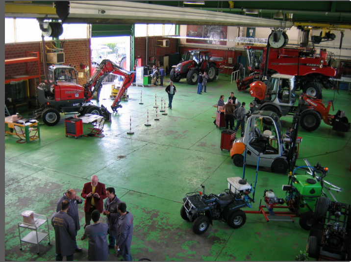
Atelier du Lycée des métiers Georges Cormier, 3 pôles ont été mis en place pour accueillir les candidats sur chaque option du bac pro maintenance des matériels .