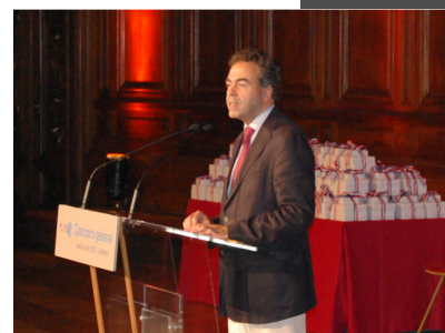
Luc Chatel, Ministre de l'Éducation Nationale

Le ministre a rappelé que ce concours permet "la reconnaissance de ceux qui recherchent l'excellence, la méritocratie" .