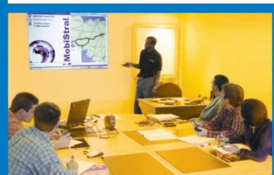
> Une salle de formation