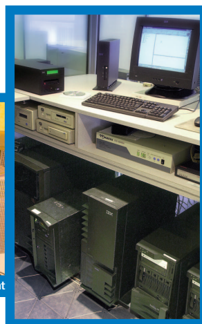
> Salle des Serveurs