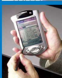
> Application MobiStral