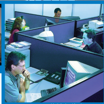
> Unité de développement