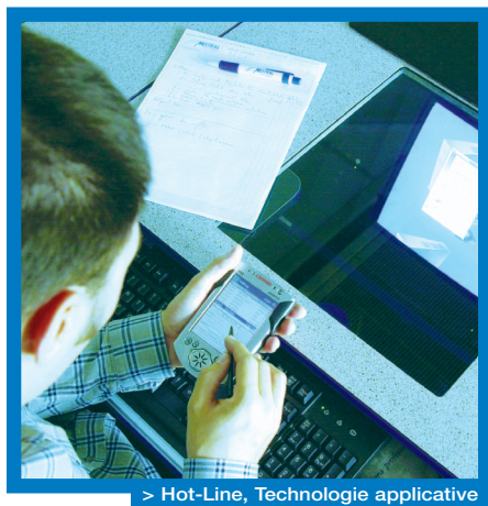
> Hot-Line, Technologie applicative