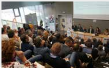
Rencontre écoles entreprises ASDM-Éducation Nationale à Vendôme en novembre 2018. Plus de 150 participants sur les deux jours d'échanges.