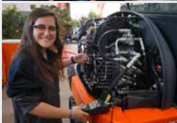
Féminisation des métiers du secteur grâce à la nouvelle génération.