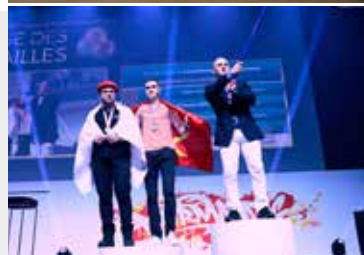
Le podium des champions de France en maintenance des matériels. Le médaillé d'or a représenté la France pour notre métier « Heavy Vehicle Technology » en Russie, à la compétition internationale de 2019.