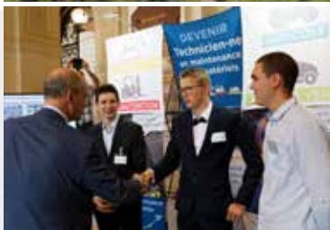
Les 3 lauréats du Concours général des métiers en maintenance des matériels et Jean-Michel Blanquer, ministre de l'Éducation Nationale, lors de la cérémonie de remise des prix à la Sorbonne en juillet 2019.