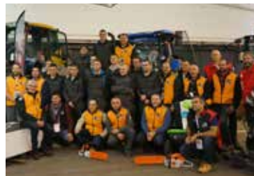
L'équipe des jurés et les compétiteurs à la finale nationale des WorldSkills à Caen en 2018.