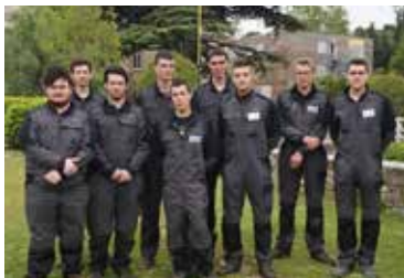
Les 9 candidats sélectionnés pour les épreuves pratiques du Concours général des métiers de la maintenance des matériels 2019.