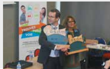
Pascale Costa, Inspectrice Générale de l'Éducation Nationale en charge de la filière Maintenance des matériels.